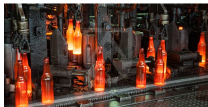
Chapadlo na skleněné láhve